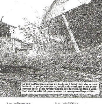
Le site de l'ancienne mine est toujours à l'état de friche abandonnée. Le projet de réhabilitation des déchets, un lieu à vocation mémorielle tant pour un musée ou un espace d'exposition.